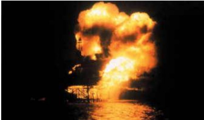
Eksplosjonsbeskyttelse må tas på alvor, her fra Piper Alpha ulykken på britisk sektor i Nordsjøen.

For oss som jobber med olje- og gassrelatert virksomhet er det viktig å vurdere risikoen for eksplosjoner på grunn av gassene som er tilstede. Men, det ikke bare olje- og gassvirksomheten som er utsatt. Vi har eksplosjonsfare i forbindelse med farmasøytisk industri, lakkeringsvirksomhet og all type produksjon hvor det benyttes antenkelige løsemidler. Det er også eksplosjonsfare forbundet med støv, for eksempel i møller.